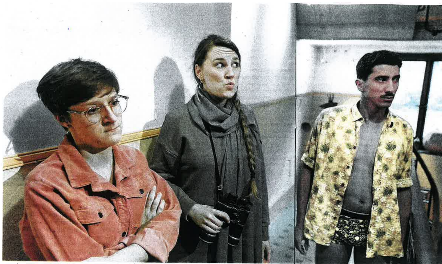
Comédiens suisses et québécois se donnent la réplique dans «Hors Connexion».

Les soirées des plus célèbres dîners-spectacles de Suisse romande se muent en une version Covid-compatible de ce concept où public et comédiens se mêlent afin de retrouver un assassin. Une enquête à domicile avec fondue en option.